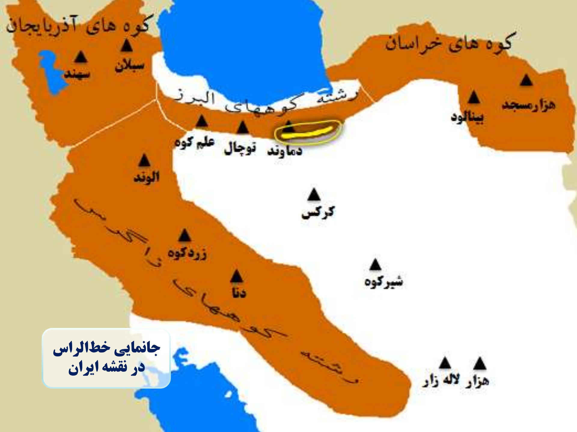
جانمایی خط الراس در نقشه ایران